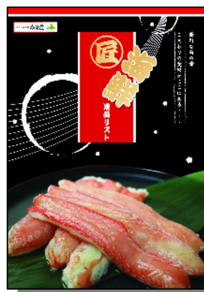
匠 海鮮景品リスト 【2枚】