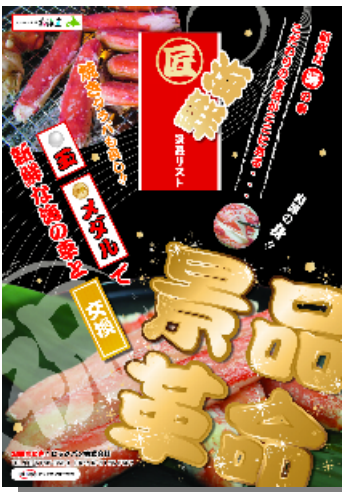
告知用ポスター(B2) 【2枚】