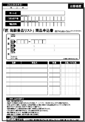
商品申込書 【10セット】